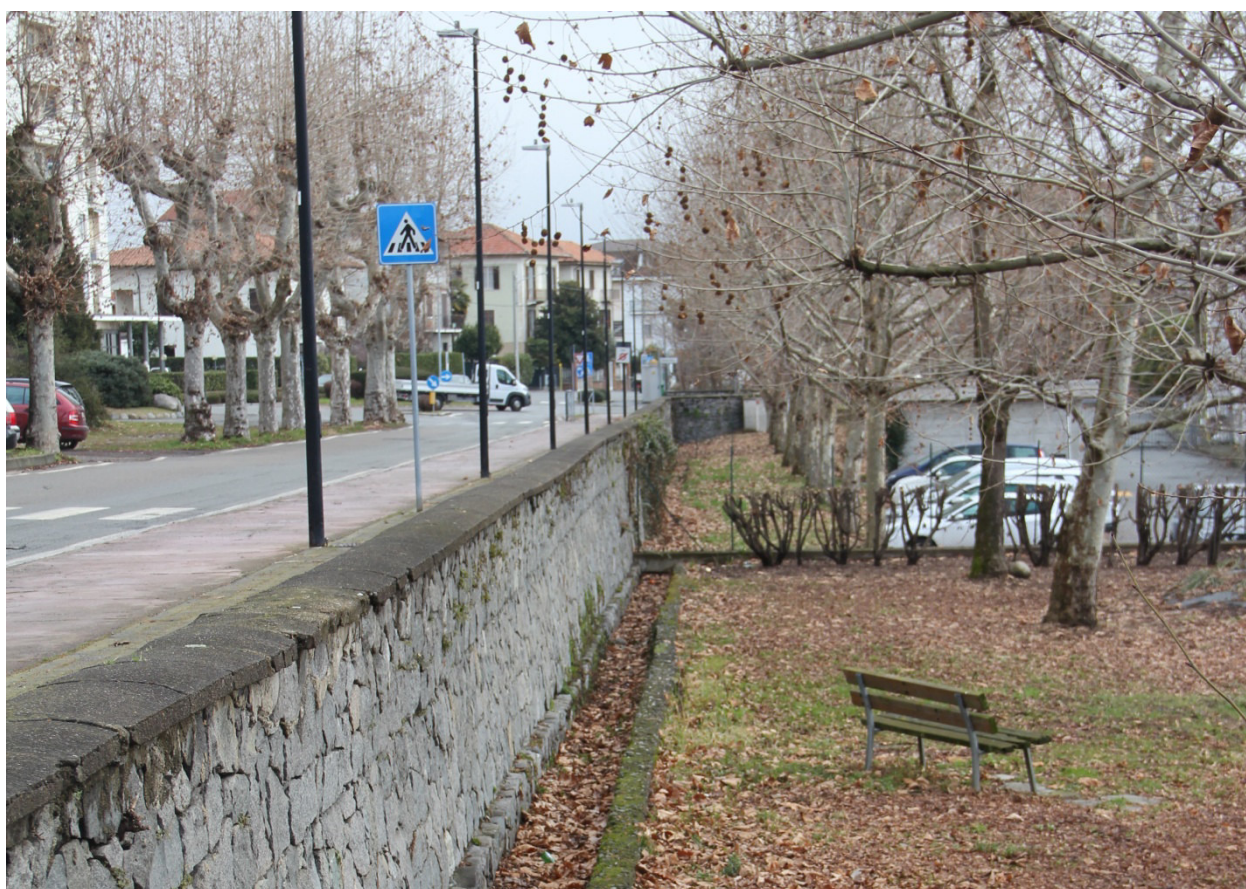
Via Italia... spostamento pista sull'altro lato della strada