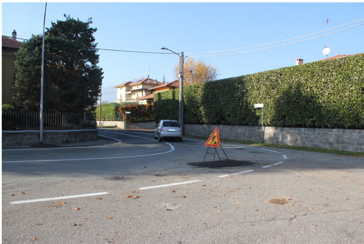
Incrocio critico... verso via Brignana