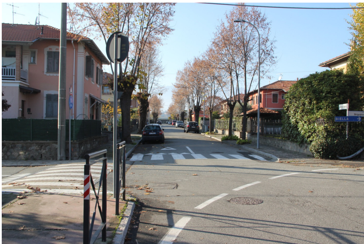
Incrocio critico... verso via G.T. Mullatera