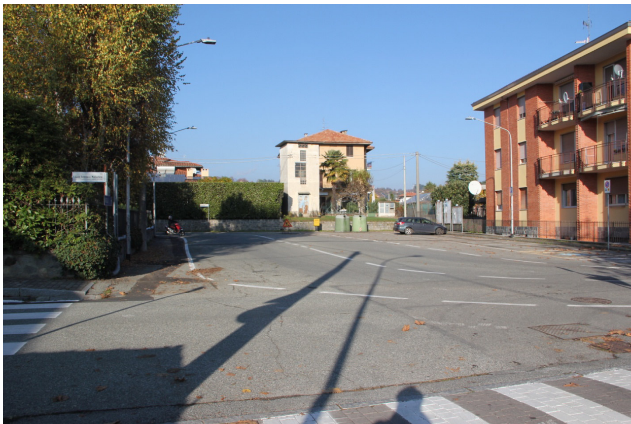
Incrocio critico... lo slargo con il parcheggio