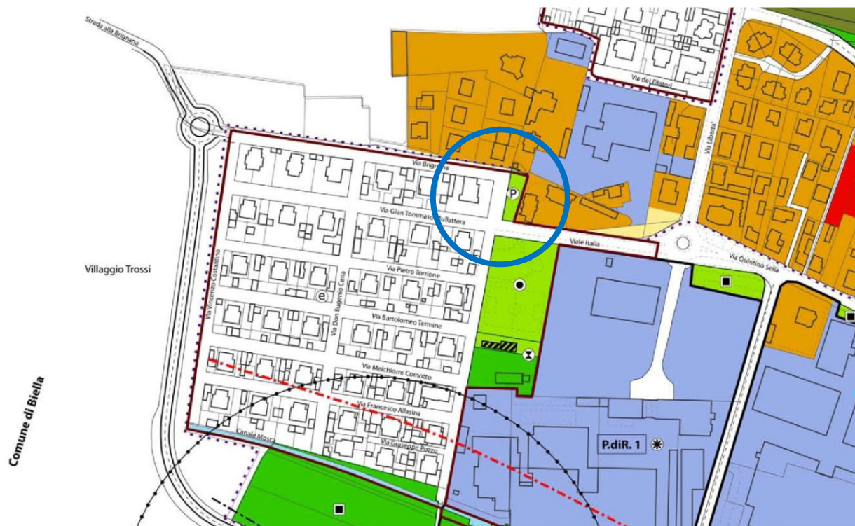
Estratto elab. PR.3C/V1 – uso del suolo urbano in scala 1:2000