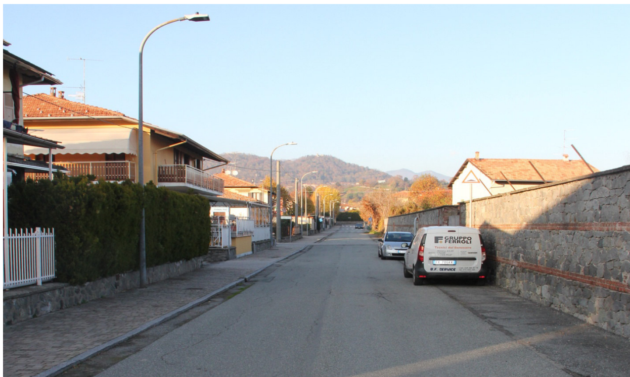
Via P. Serpentiero in direzione nord (doppio senso di marcia - conservazione del marciapiede)