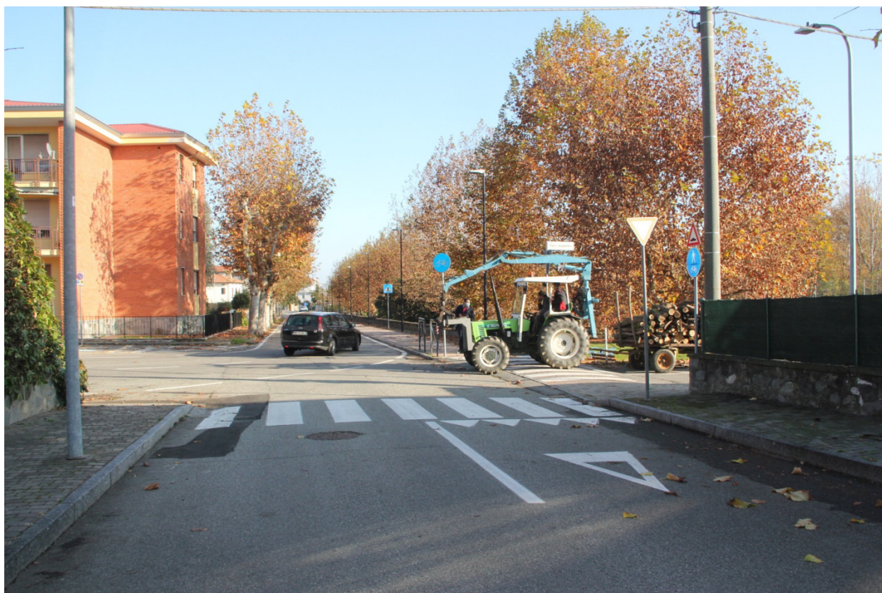
Incrocio tra viale Italia e via P. Serpentiero... da via G.T. Mullatera